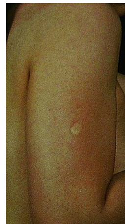
Следы прививки против оспы

В настоящее время в мире есть лаборатории, где хранятся вирусы оспы. В разных странах имеются разработанные модификации живых оспенных вакцин.